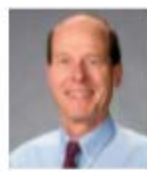
Bernhard Hennig USA J Nutr Biochem 主编