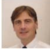
Marc Diederich Luxembourg J Cancer Preven 主编